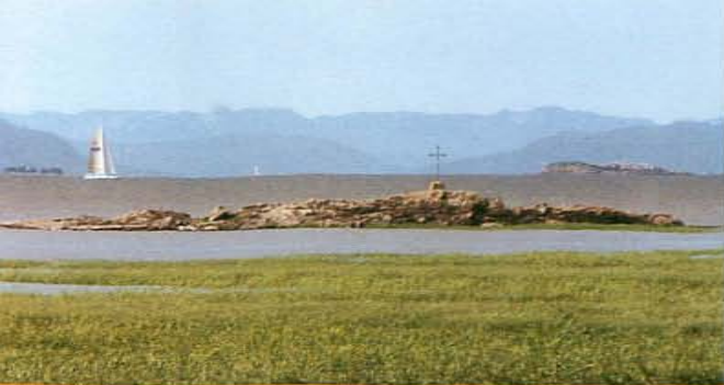
Le Rocher Panet, un îlot rocheux surmonté d'une croix, a inspiré une fort belle légende.